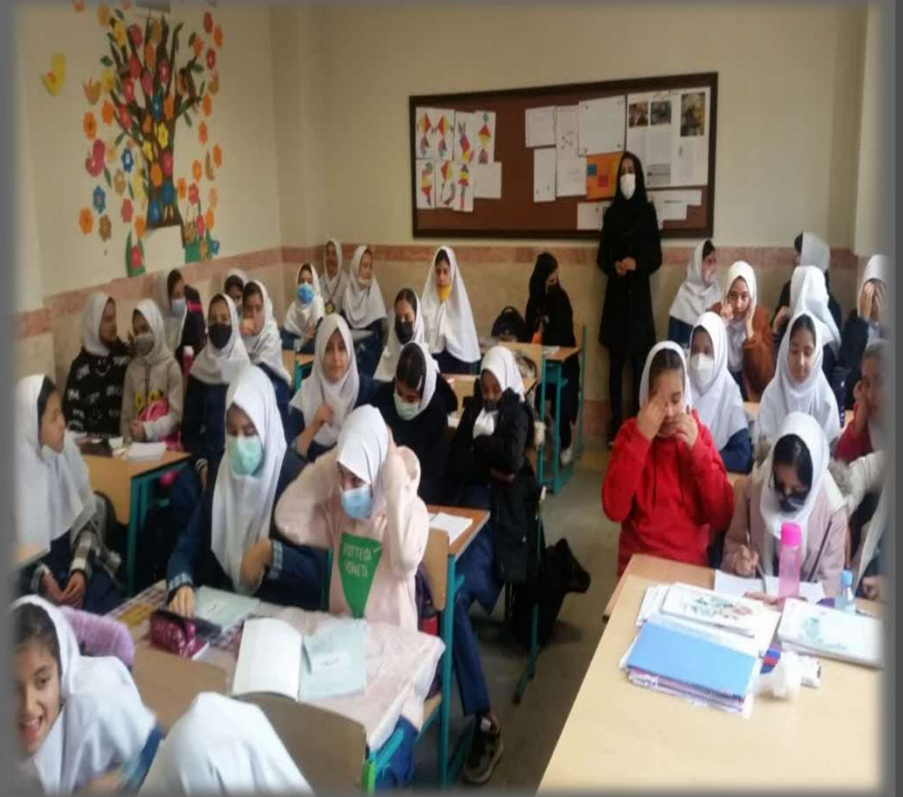
برگزاری جلسات آموزش در مدارس