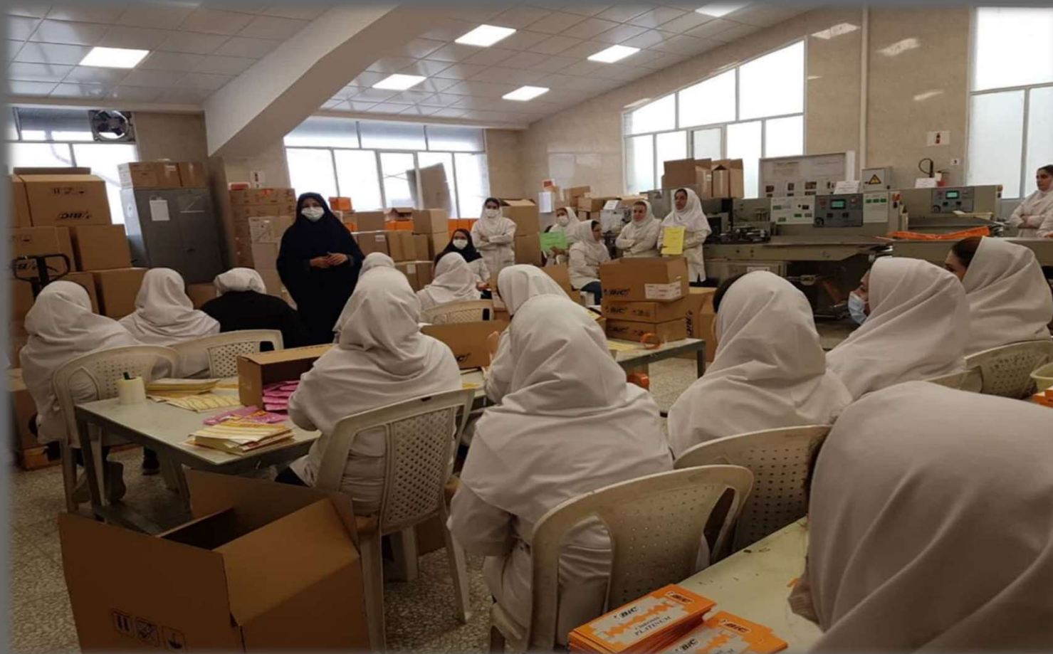
برگزاری جلسه آموزش در کارخانه کارنوونیک